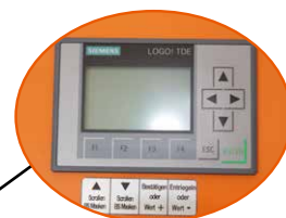
EW 18-e: mit digitalem Display